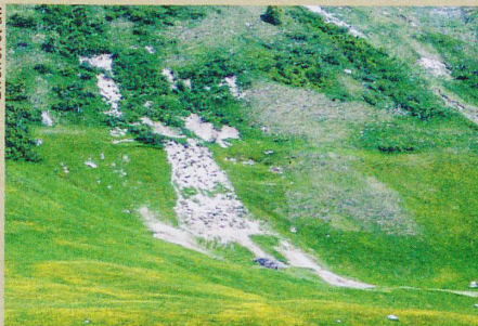
Une pente érodée dans la vallée d'Urseren, notamment à cause de l'élevage bovin.