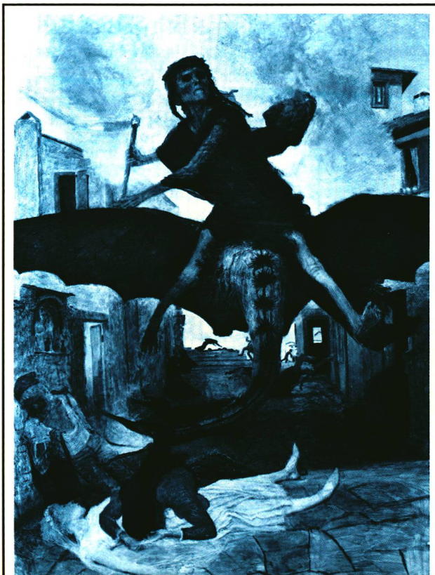
Arnold Böcklin: Die Pest (1898). Depositum der Eidg. Gottfried-Keller-Stiftung, Kunstmuseum Basel. Im 19. Jahrhundert waren die Schrecken der Pest noch tief in der Vorstellungswelt verankert. Dennoch haben andere Faktoren das Bevölkerungswachstum der Schweiz mehr gebremst.

mangels Besitz normalerweise ledig geblieben wären, plötzlich in der Lage, sich zu verhehlichen: sie übernahmen die Höfe von den verstorbenen Herren und vermochten so, eigene Familien zu ernähren. Die anschließende Erhöhung der Geburtenzahlen trug rasch dazu bei, die Anzahl der Epidemieopfer zu kompensieren. Hingegen wirkten wiederkehrende Hungersnöte — und allen voran jene vom Ende des 17. Jahrhunderts — als die eigentlichen Hemmnisse des Bevölkerungswachstums. In solchen Mangeljahren erhöhte sich nicht nur die Sterberate, sondern es sahen sich auch viele Menschen zur Auswanderung gezwungen — zum Beispiel nach Frankreich und Italien. Doch im Gegensatz zur landläufigen Meinung verliesen die Menschen ihre Heimat weniger, um sich als Söldner zu verdingen, denn um weiterhin ihren Beruf auszuüben. Prof. Mattmüller zählte allein für die Region Basel am Ende des 17. Jahrhunderts auf sechs Todesfälle eine Person, die auswanderte.