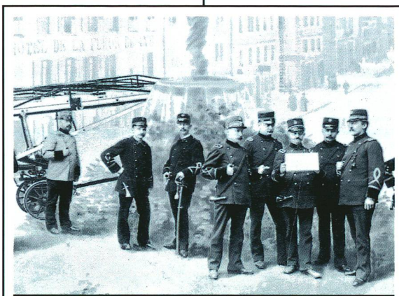
Das Feuerwehrbattalion von La Chaux-de-Fonds anno 1896. Nach dem Brand von 1794 hat die Feuerwehr sorgfältig alle Baupläne aufgehoben, was die Dokumentensuche der Wissenschaftler erheblich erleichtert.

Die 40 Städte sind alphabetisch geordnet. Der erste Band beginnt mit "Aarau", der letzte endet mit "Zürich". Um schliesslich auch das ewige Sprachproblem möglichst gerecht zu lösen, beschloss man, jede Stadt in der ursprünglich von ihren Einwohnern gesprochenen Sprache zu beschreiben.