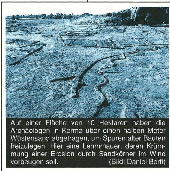
Auf einer Fläche von 10 Hektaren haben die Archäologen in Kerma über einen halben Meter Wüstensand abgetragen, um Spuren alter Bauten freizulegen. Hier eine Lehmmauer, deren Krümmung einer Erosion durch Sandkörner im Wind vorbeugen soll.

Während die Archäologen die Vergangenheit des alten Kerma heraufbeschwören, stossen ihre Helfer, 80 Erdarbeiter aus dem Sudan, ganz unvermutet mit ihrer eigenen Kulturgeschichte zusammen. Sie haben