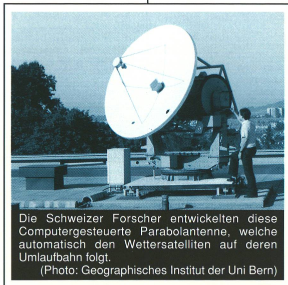
Die Schweizer Forscher entwickelten diese Computergesteuerte Parabolantenne, welche automatisch den Wettersatelliten auf deren Umlaufbahn folgt.

"Photo" ist eigentlich nicht der richtige Ausdruck, denn die Satelliten schicken bloss eine Menge Ziffern auf die Erde: über 8 Millionen pro Bild!