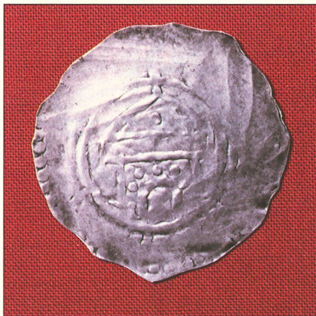
bild zeigt Herrscherdarstellungen, Kirchenfassaden oder ein Kreuz. Weil die Münzen so dünn sind, durchdringen sich die Sujets auf Vorder- und Rückseite, was ihre Deutung erschwert.

Gegenwärtig läuft die Auswertung des gesichteten Münzmaterials. Der Historiker erfasst die verschiedenen