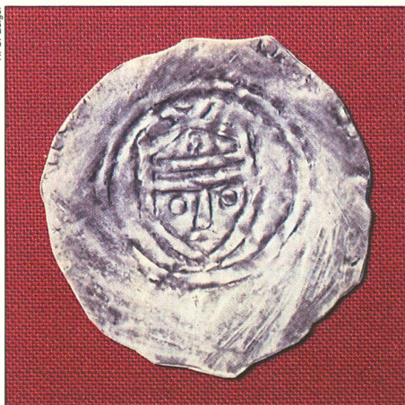
Vorderseite: Kaiser Heinrich III. (1039-1056) Rückseite: Kirchenfassade