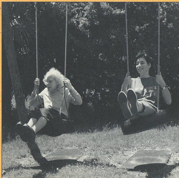
Opereale civico, Lugano

Haushälterischer Umgang mit Sozialfranken – leichter gesagt als getan. Auch das NFP 29 kennt keine einfachen Antworten. Zweck des Vorhabens war übrigens gar nicht das Finden von Patentrezepten, sondern eine sorgfältige Bestandaufnahme der komplexen Szene und das Stellen kluger Fragen. Mit andern Worten, das Programm soll Entscheidungsgrundlagen liefern und Denkanstösse vermitteln. Den richtigen Weg muss dann unsere demokratische Gesellschaft selber finden.