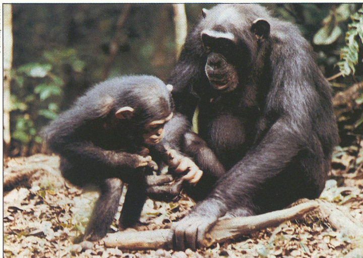
Mutter als Lehrmeisterin: Mit ihrem Kind teilt sie die Nüsse ( Coula oleosa ), welche sie soeben geschickt geöffnet hat.

Diese Beobachtung zeigt, dass die in einer Sippe gepflegte Technik nicht in jedem Fall bestmöglich an die Umwelt angepasst ist. Doch gerade solche nicht immer optimale, nicht perfekt rationelle Verhaltensweisen sind ja ein Ausdruck von Kultur – und damit einer engeren Verwandtschaft zwischen Affen und Menschen, als wir dies bis anhin wohl geglaubt hatten. ☐