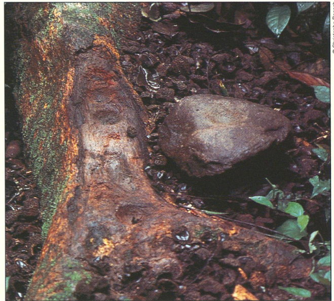
Die "Werkstatt" einer Schimpansensippe: Die Baumwurzel dient als Amboss, ein Granitbrocken als Hammer zum Zertrümmern der Schalen von Nüssen ( Panda oleosa ).

Erstes Beispiel: Schimpansen geben sich zuweilen