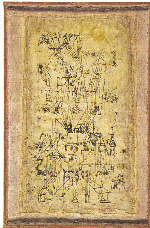
«Luftschloss», 1922, Kunstmuseum Bern, Hermann und Margrit Rupf-Stiftung. Wasser- und Ölfarbe auf Gipsgaze.

Für die Datierung besitzen die Kunsthistorikerinnen zum Glück einen Schlüssel: Im Nachlass von Paul Klee finden sich Hefte mit codierten Notizen. So bedeutet