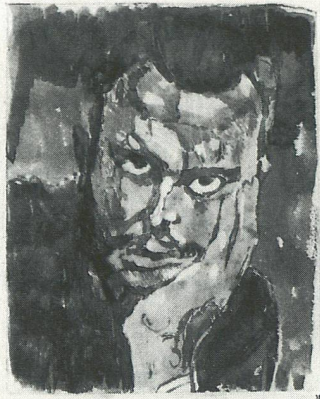
Paul Klee im Alter von 30 Jahren (Selbstporträt). Schwarzes Aquarell auf Briefpapier und Karton.