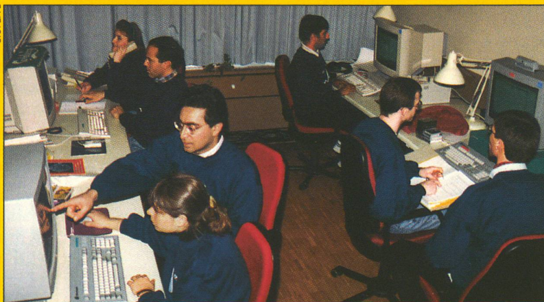
Zum Fototermin einheitlich blau gekleidet: die Mitarbeiter des MPEG-4-Teams in ihrem Lausanner Labor.

Zum Glück gibt es eine Methode, um diese Informationsflut online zu bewältigen oder aber einen Spielfilm von zwei Stunden Dauer auf einer CD zu speichern: die