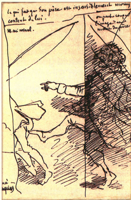
Diese Skizze zeigt, wie Rodolphe Töpffer die Comic-Darstellungsweise entwickelt. Zuerst zeichnet er den Vater, der seinem Sohn einen Fusstritt gibt, als ganze Figur, doch schliesslich lässt er nur Hand und Bein stehen. Das wiederholt sich mehrmals im Album und sorgt so für eine humoristische Note (Manuskript von «Histoire de Jacques», 1844).