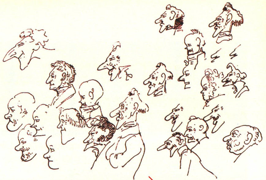
Profilstudien für Töpffers Album «Monsieur Crépin». Die schliesslich realisierte Figur ist durch den Strich bezeichnet.

Schule machen sollte. Dafür konnte man sich nichts Besseres wünschen als eine Unterstützung durch den grossen Goethe.