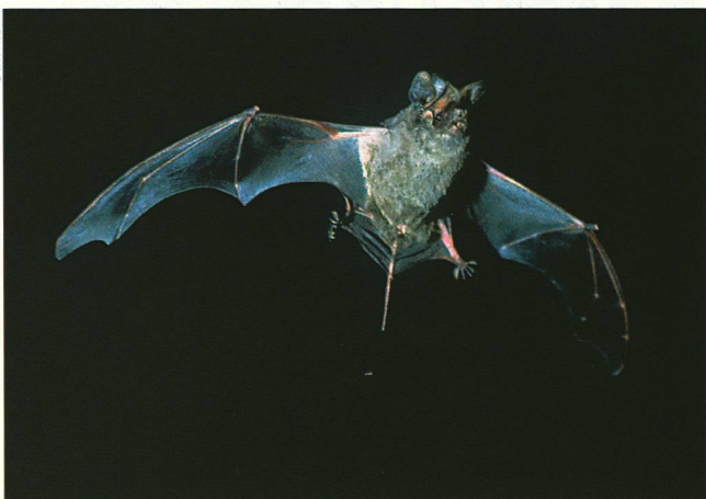
Im Flug lässt sich die Bulldoggfledermaus an ihrem abstehenden Schwanz erkennen.

und immer wieder die Richtung wechseln. «Die nächtlichen Fahrten führen mich manchmal rhonetalabwärts bis nach Martigny und sogar bis zum Val d'Illicz», erzählt er. «Oft verlor ich auch die Spur, doch gelang es mir später meistens, den Kontakt wiederherzustellen, indem ich systematisch die Zone absuchte, wo ich das akustische Signal zuletzt gehört hatte.»