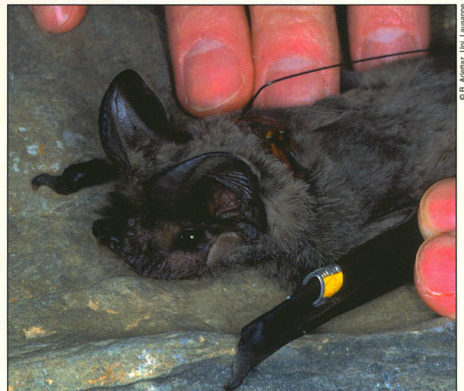
Das Halsband dieser beringten Bulldoggfledermaus enthält einen kleinen Sender, der auch die Körpertemperatur übermittelt.

Erreicht das Thermometer den Gefrierpunkt, reagieren Bulldoggfledermäuse mit einem Anstieg der Körperwärme auf gegen 20 Grad. Dabei verbrauchen sie vierzigmal mehr Energie als beim Verharren auf Sparflamme. Einige kalte Tage vermögen so die Reserven derart zu erschöpfen, dass diese Art den Verlust unbedingt durch Nahrungsaufnahme ausgleichen muss. Es ist also die Kälte, welche unsere Bulldoggfledermäuse zu winterlicher Jagd zwingt.