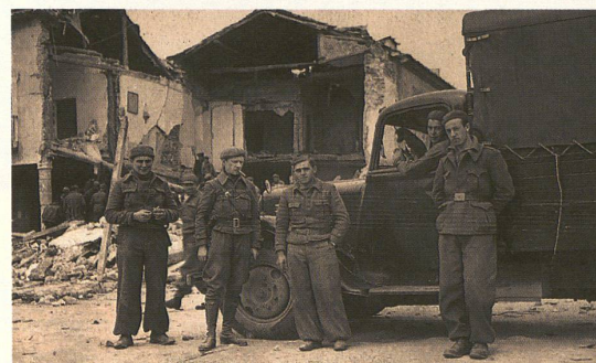
Panzerwagen der republikanischen Truppen (oben); Schweizer Spanienkämpfer vor einem von den Faschisten zerstörten Haus in Torija, März 1937 (unten).