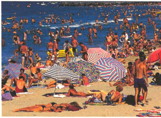
KNACKNUSS: Ob Sandkörnchen am Strand oder Orangen im Supermarkt, die Frage ist dieselbe: Welche Anordnung erreicht die höchste Dichte?