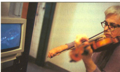
FINGERFERTIGKEIT: Damit die Finger beim Geigenspiel nicht straucheln, ist viel Koordination und Hirnleistung nötig.