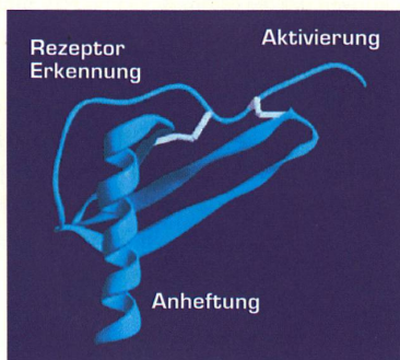
Räumliche Struktur eines Chemokins

Heute sind über 40 verschiedene Chemokine bekannt. Chemokine rufen jedoch nur diejenigen Immunabwehrzellen zu Hilfe, die mit spezifischen Andockstellen auf der Zelloberfläche ausgerüstet sind, den so genannten Chemokinrezeptoren. Und jede dieser bis heute bekannten 17 unterschiedlichen Andockstellen lässt nur bestimmte Chemokine heran.