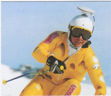
GPS IM SCHNEE: Satelliten schlüpfen in die Rolle des Trainers. Sie informieren den Skirennfahrer, wo auf der Piste er wertvolle Sekunden gewonnen oder verloren hat.