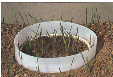
GENTECH-WEIZEN: Welche Auswirkungen hat der brandpilzresistente Weizen der ETH Zürich auf Insekten und Bodenlebewesen? Schweizer Biosicherheitsforscher versuchen, die Risiken abzuschätzen.