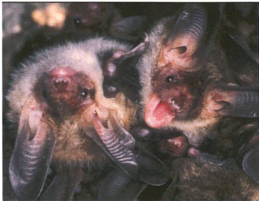
FAMILIENTREU: Weibchen der Bechsteinfledermäuse verbringen ihr ganzes Leben in der Sippe, in der sie geboren wurden. Dies zeigen Verhaltensbeobachtungen und genetische Analysen der Uni Zürich.