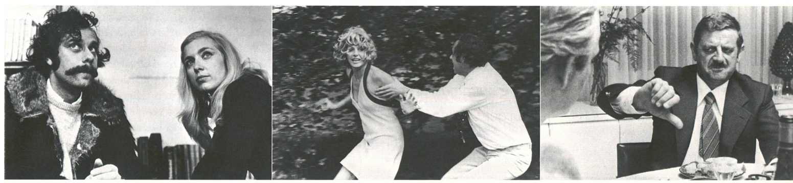
Schweizer Nouvelle Vague: «La Salamandre», «Les Arpenteurs», «L'Invitation», «Die Schweizermacher» (von links).

Autorenkino oder Autoren-Dokumentarfilme: Dazu zählen die markanten Werke von Richard Dindo, beispielsweise «Die Erschiessung des Landesverrätters Ernst S.», oder Alexander Seilers «Siamo Italiani», der sich mit der bisweilen kritischen Situation italienischer Einwanderer in der Schweiz befasst. Die Wahrheit kann nicht immer schön ausgedrückt werden, ist auch nicht immer gut anzuhören. Das neue Kino ist verärgert, es ruft ein Filmfestival ins Leben, auf dem es sich zeigen will: die Solothurner Filmtage – eine heilsame Initiative, die sich trotzdem als hinderlich erweisen könnte. Dort entwickelt sich ein demonstrativer Geist, ein Radikalismus, der