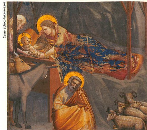
Das Bild von Maria mit Kind wurde nicht vom Christentum erfunden.