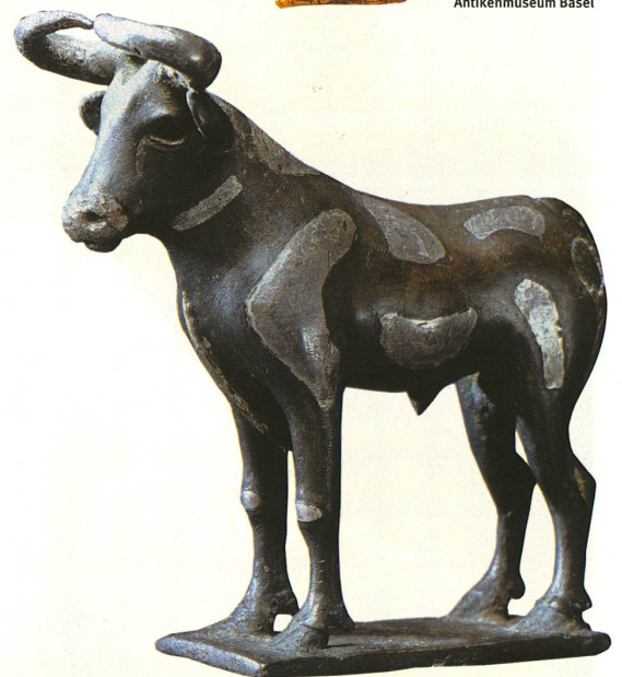
Der Stier, ein sumerisches göttliches Symbol um 2500 v. Chr.