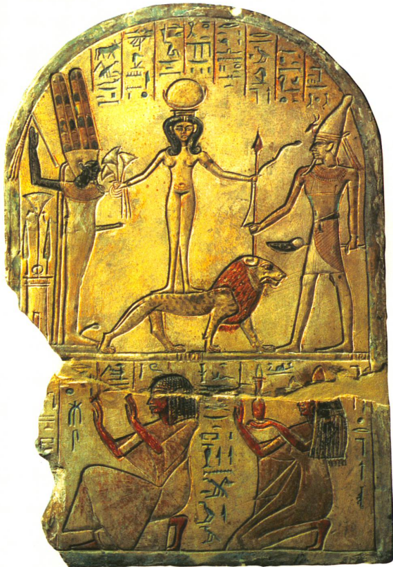
Die Göttin Qadishu zwischen einem ägyptischen und einem kanaanäischen Gott Ägyptisches Museum, Turin