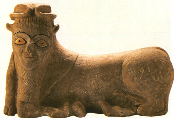
Stier mit Menschenkopf (Syrien, um 2200 v. Chr.), stellt die männliche Fruchtbarkeit dar und war vielleicht eine Nebengottheit.