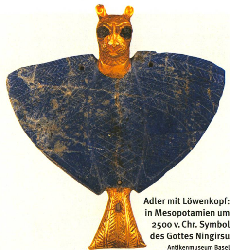
Adler mit Löwenkopf: in Mesopotamien um 2500 v. Chr. Symbol des Gottes Ningirsu Antikemuseum Basel

Weitere Informationen zu Flückigers Forschungsarbeit: www.ane.unibe.ch