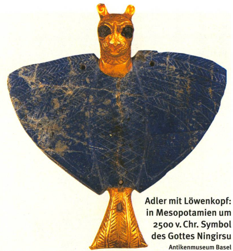
Adler mit Löwenkopf: in Mesopotamien um 2500 v. Chr. Symbol des Gottes Ningirsu Antikenmuseum Basel

Weitere Informationen zu Flückigers Forschungsarbeit: www.ane.unibe.ch