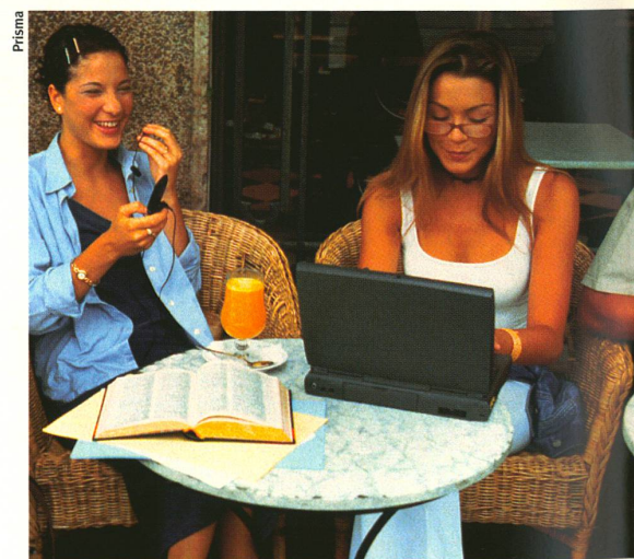
Mobiltelefone und Laptops könnten mobile Antennen bilden.