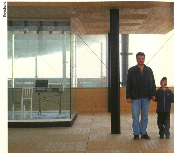
Erwartungen und Skepsis: die Schweizer über Genforschung