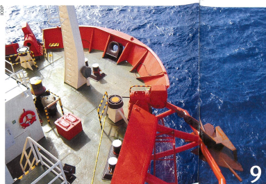
Schweizer Forschende erkunden den Meeresboden vor Tahiti.