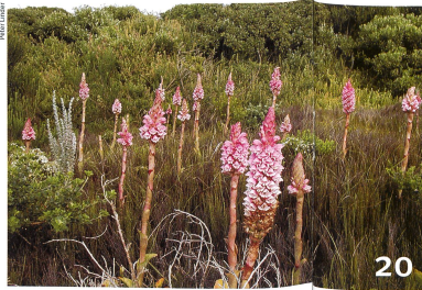
Auf den Spuren der enormen Pflanzenvielfalt in Südafrika