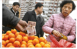
Links: Stadtansicht von Schanghai mit dem Fluss Huangpu und der bekannten Promenade Bund. Oben: Strassenmarkt in Peking. Die chinesischen Zeichen im Text bedeuten «China» (klein, S. 18) und «Menschenrechte» (gross).

Gegenläufige buddhistische Werte Ein weiteres interessantes Resultat ergibt sich aus den religiösen Werthaltungen. In den Internetesites grosser religiöser Gruppierungen, vor allem der chinesisch-buddhistischen, chinesisch-taoistischen und konfuzianistischen Vereinigungen, ermittelte die Wissenschaftlerin wichtige religiöse Werte und liess sie in den Fragebogen einfließen. Es zeigte sich, dass bestimmte Wertekombinationen direkt mit der Haltung zu Menschenrechten gekoppelt sind. Wer gesellschaftsbezogene, vor allem im Konfuzianismus wichtige Werte wie Wohltätigkeit, Respekt gegenüber anderen und klassisch hierarchische Familienstrukturen hochhält, findet auch Menschenrechte wichtig. Wer klassisch