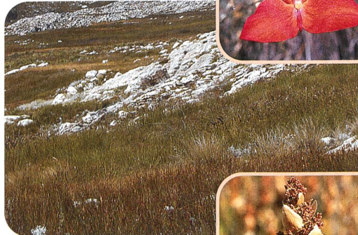
Elegia extensa (Restionaceae)