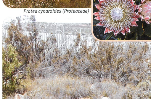
Ein Mosaik aus verschiedensten Boden- und Gesteinstypen trägt zur grossen Pflanzenvielfalt am Kap der Guten Hoffnung bei.