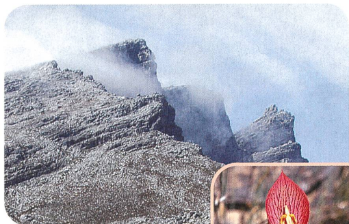
Disa uniflora (Orchidaceae)