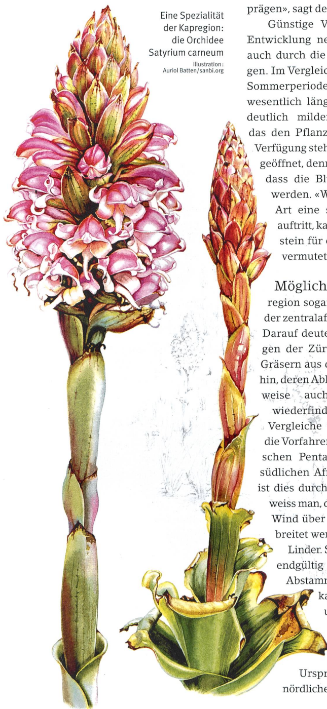
Eine Spezialität der Kapregion: die Orchidee Satyrium carneum Illustration: Auriol Batten/sanbi.org

Möglicherweise ist die Kapregion sogar eine bedeutende Wiege der zentralafrikanischen Gebirgsflora. Darauf deuten weitere Untersuchungen der Zürcher Wissenschaftler an Gräsern aus der Gattung Pentaschistis hin, deren Abkömmlinge sich beispielsweise auch am Kilimandscharo wiederfinden. «Unsere genetischen Vergleiche weisen darauf hin, dass die Vorfahren der 15 bekannten tropischen Pentaschistis -Arten aus dem südlichen Afrika stammen. Technisch ist dies durchaus möglich, denn heute weiss man, dass Pflanzensamen durch Wind über sehr weite Strecken verbreitet werden können», konstatiert Linder. Sollten sich diese Befunde endgültig bestätigen, müsste die Abstammungsgeschichte der afrikanischen Pflanzenwelt umgeschrieben werden. Bisher dachte man nämlich, dass die Flora dieser Zone ihren Ursprung in Pflanzen aus den nördlichen Breiten hat. ■