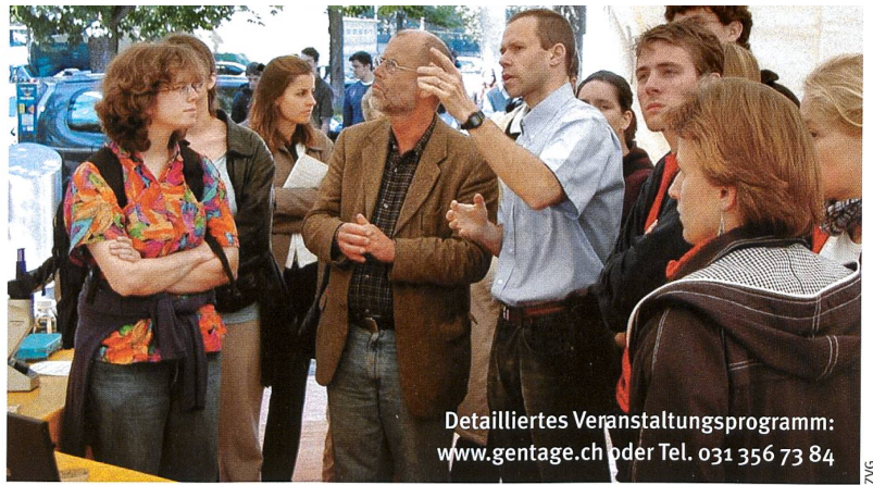
Detailliertes Veranstaltungsprogramm: www.gentage.ch oder Tel. 031 356 73 84

«Horizonte», Schweiz. Nationalfonds Wildhainweg 20, 3001 Bern Fax 031 308 22 65, E-Mail: pri@snf.ch