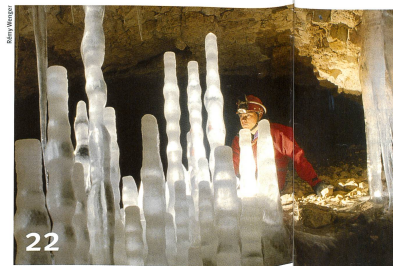
Auf Eishöhlen hat der Sommer kaum einen Einfluss.