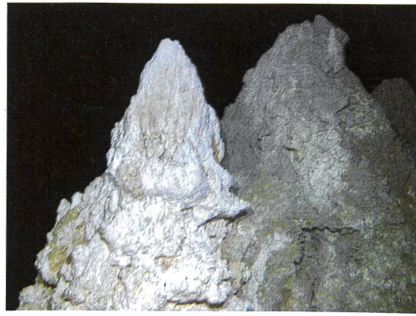
Die Kalktürme beherbergen extreme Lebewesen.

Mitten im Atlantischen Ozean erhebt sich eine «verlorene Stadt»: Grandios geformte, weisse Schloten ragen über 60 Meter in die Höhe. Diese Strukturen interessieren die Forschenden mehr als das sagenhafte Atlantis. Mit gutem Grund, denn auf ihnen wimmelt es nur so von Leben, und es wird vermutet, dass die dort herrschenden Bedingungen sehr ähnlich sind wie jene zur Zeit der Entstehung des Lebens. «Lost City» befindet sich 15 Kilometer von der Achse des Mittelatlantischen Rückens entfernt in 900 Meter Tiefe und auf 30° nördlicher Breite. Eine Reihe von Verwerfungen lassen an diesem Ort Gestein aus dem Erdmantel hervortreten. Durch Wechselwirkungen zwischen diesem Gestein und dem Meerwasser entstehen stark methan- und wasserstoffhaltige Flüssigkeiten mit einem pH-Wert zwischen 9 und 11 und einer Temperatur von 40 bis 90°C. Treffen die Flüssigkeiten auf Meerwasser, wird Kalk (Kalziumkarbonat) ausgefällt. So entstehen Kalkgebilde, die eine Höhe von mehreren Dutzend Metern erreichen können. Sie beherbergen ein Ökosystem, das hauptsächlich aus Archaea besteht.