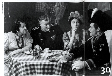
Erstes grosses Lexikon zum Theaterschaffen in der Schweiz