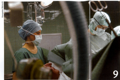
Forschende und Ärzte entwickeln neue Therapien gegen Krebs.