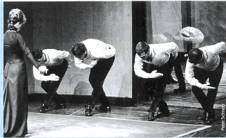
«Jakob von Gunten», 1988