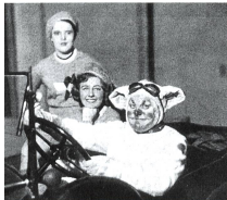
«Mit Bonzo im Auto durchs Wunderland», 1930

Andreas Kotte (Hg.): Theaterlexikon der Schweiz. 3 Bde., ca. 2000 Seiten, 800 Abb., Chronos-Verlag, Zürich 2005. Subskriptionspreis bis 31. Dezember 2005 CHF 168.–, danach CHF 198.–