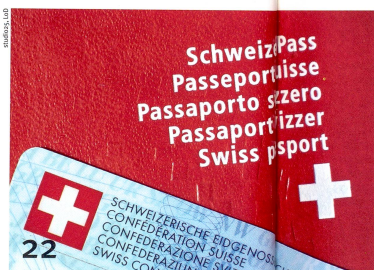
Der Weg zum Schweizer Bürgerrecht ist ein Hindernislauf.