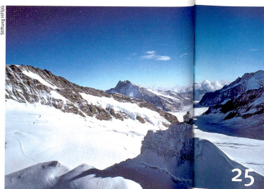
Reiche Geschichte: Sphinx-Observatorium auf dem Jungfrauoch

Umschlagbild oben: L.J. Sally Liu, Forschungsprofessorin Universität Basel