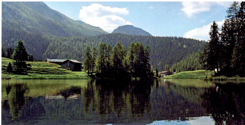
Die Sommeruni in Davos lässt Zeit für Ausflüge an den Schwarzsee (oben) oder ins Sertigtal.

«Horizonte», Schweiz. Nationalfonds Wildhainweg 20, Postfach 8232, 3001 Bern Fax 031 308 22 65, E-Mail: pri@snf.ch