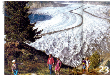
Gletscherspuren liessen Geologen vor 200 Jahren über die Entstehung der Erde rätseln.