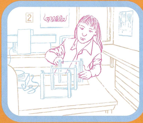
Abb. 2 Tausende von Forschungsgruppen aus den Bereichen Biologie, Biochemie, Pharmazie, aber auch Medizin sowie aus verwandten Fachgebieten entdecken und erforschen weltweit neue Proteine. Ihre Erkenntnisse werden in wissenschaftlichen Journalen publiziert.

Abb. 1 Mit Hilfe biochemischer und optischer Verfahren ermitteln Wissenschaftler im Labor die charakteristische Abfolge der Aminosäuren eines neu entdeckten Proteins. Sie bestimmen dessen räumlichen Aufbau und untersuchen, welche Stelle des Proteins mit anderen Molekülen interagiert, seine Wechselwirkungen mit anderen Proteinen etc.