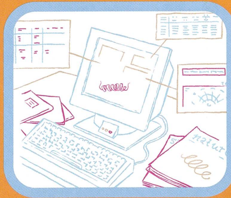
Abb. 3 Nun beginnt die Arbeit der Wissenschaftler von Swiss-Prot: Sie übernehmen die Daten eines Proteins aus den Publikationen und stellen sie Forschern weltweit in der geordneten Form von Swiss-Prot auf dem Internet zur Verfügung. Dies ist sowohl Kopfsache als auch Handarbeit – in den wenigsten Fällen werden die neuen Erkenntnisse direkt von den Forschern an die Datenbank übermittelt.

Abb. 4 Swiss-Prot ist eine annotierte, d.h. mit zusätzlichen Informationen und Kommentaren versehene Datenbank. Sie enthält neben der Aminosäureabfolge und Literaturreferenzen auch Informationen über Struktur und Funktion der Proteine. Zusätzlich stellt Swiss-