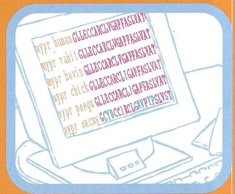
Abb. 5 Dank Swiss-Prot sind Wissenschaftler weltweit in der Lage, die Aminosäuresequenz eines neu gefundenen Proteins mit der Abfolge aller bislang bekannten Eiweisse zu vergleichen. Wird eine Übereinstimmung gefunden (z.B. mit einem bekannten Protein der Hausmaus), liefert dies Hinweise über Struktur und Funktion des neuen Eiweisses, die durch gezielte Tests auf ihre Richtigkeit überprüft werden können.

Prot auch Software für die Analyse und den Vergleich von Proteinen zur Verfügung. Die Daten werden regelmässig mit Informationen aus neueren Publikationen und Reviews erweitert und aufgefrischt.