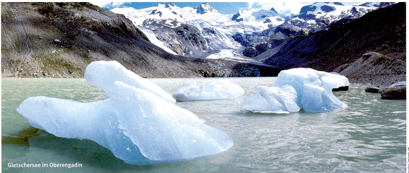
Gletschersee im Oberengadin