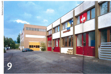
9 Wo sind sie? Warum Fremde in der Schweiz politisch unsichtbar bleiben.