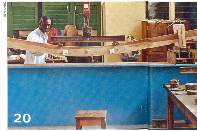
20 Hält der Träger wirklich? Was Brücken in Ghana bewirken.