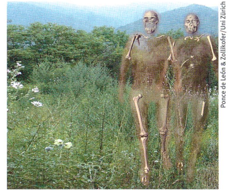
Ponce de León & Zollikofer/ Uni Zürich

Science (2007), Band 317, Seiten 111–114