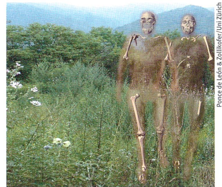
Ponce de León & Zollikofer/ Uni Zürich

Science (2007), Band 317, Seiten 111–114