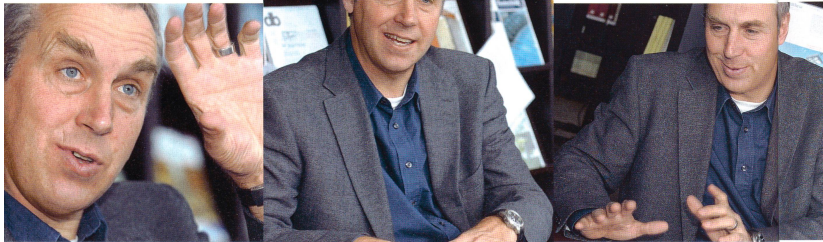
VON ANNA HOHLER

In manchen Alpenregionen der Schweiz ist die Bevölkerung so stark geschrumpft, dass die Dorfgemeinschaft auseinanderfällt. Wie kann man der Abwanderung entgegenwirken? Soll die Politik überhaupt aktiv eingreifen? Ein Ausblick mit dem Geografen Dominik Siegrist.