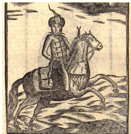
Gefahr aus dem Osten: türkischer Krieger aus dem Appenzeller Volkskalender, 1771

Angewandte Chemie, International Edition (2007), Band 46, Seiten 4089 – 4092