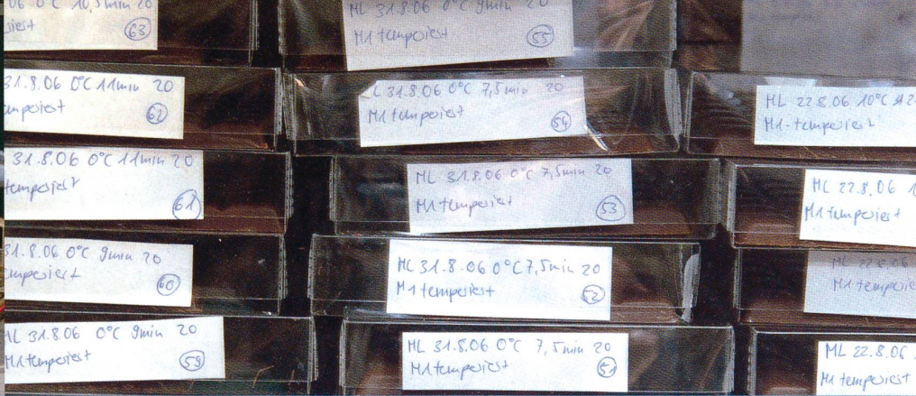
Schokoladenkreation im Labor: Im Vorkristallisator (unten links) lassen sich die Eigenschaften der braunen Masse festlegen, später wird sie zu Tafeln gegossen und bei 18 Grad gelagert (oben).