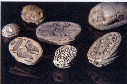
Antike Skarabäen aus der Sammlung des Bibelforschers Othmar Keel

wichtigsten Themen, mit denen sich die Spitzenforschung zu Beginn des 21. Jahrhunderts befasst. Die Auswahl will nicht repräsentativ sein, vielmehr stellt sie Forschende vor, die mit ihrer