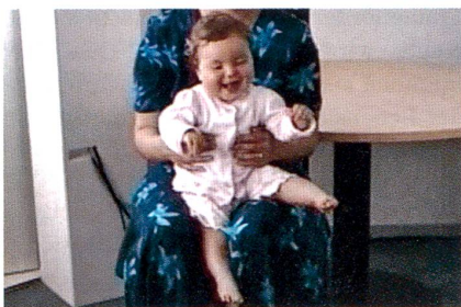
Im Sog der Töne lebt's sich leichter.

Sich im Rhythmus der Musik zu bewegen ist in allen Kulturen verbreitet und wird gemeinhin als Produkt einer schrittweisen Akkulturation gesehen, die im frühesten Alter beginnt. Zwei in Genf und Jyväskylä (Finnland) durchgeführte Pionier-