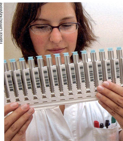
Körperfremde Substanzen – oder doch keine?

Law, Probability and Risk, 2008, Bd. 7, Nr. 3, S. 191–210