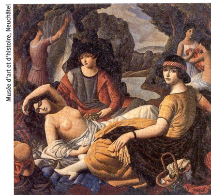
«Après le bain», 1921–22