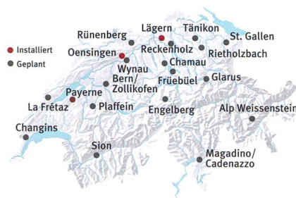
Standorte der Swisssmex-Messtellen Grafik: Swisstopo/Studio25, LoD

Vorläufig sind diese Erkenntnisse noch theoretischer Natur. Doch konnten sie kürzlich in «Nature» publiziert werden. «In den letzten Jahren hat die Wissen-