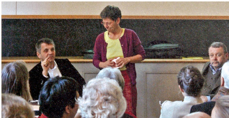
Café Scientifique Basel

Frage und Antwort stammen von der SNF-Website www.gene-abc.ch , die unterhaltsam über Genetik und Gentechnik informiert.