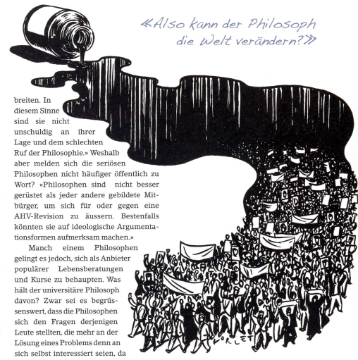
«Also kann der Philosoph die Welt verändern?»

Der Besucher hat sich so viel wie möglich zu den Ausführungen über die Identität von Bleistift und Gedanken notiert. Aber er befürchtet, das Wesentliche verpasst zu