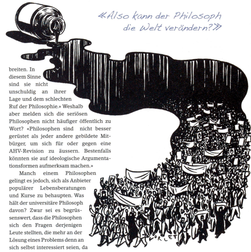
«Also kann der Philosoph die Welt verändern?»

Der Besucher widerspricht, es gebe eine ganze Reihe prominenter Philosophen, die sich in Funk und Fernsehen ausgiebig zu allem Möglichen äusserten. «Stimmt. Doch die Philosophinnen und Philosophen wehren sich nicht genug gegen diese Autoren, die gebildet klingende Seichtheiten und anderen Unsinn ver-