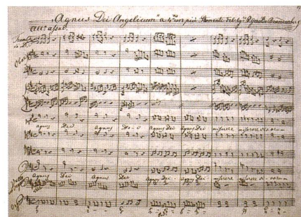
Die Partitur des «Agnus Dei Angelicum»