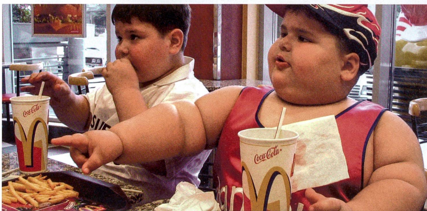
Schlemmen in der Schnellimbisskette: Zu oft ist oft zu viel.

Nature Immunology, Band 9, Seiten 424–431