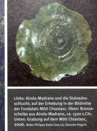
Links: Airolo-Madrano und die Stalvedroschlucht, auf der Erhebung in der Bildmitte der Fundplatz Mött Chiaslasc. Oben: Bronzescheibe aus Airolo-Madrano, ca. 1500 v. Chr. Unten: Grabung auf dem Mött Chiaslasc, 2006.