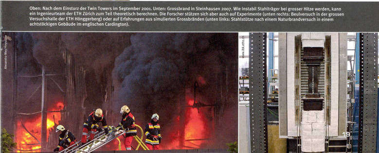
Oben: Nach dem Einsturz der Twin Towers im September 2001. Unten: Grossbrand in Strahausen 2007. Wie festhält Stahlträger bei grosser Hitze werden, kann ein Ingenieurteam der ETH Zürich zum Teil theoretisch berechnen. Die Forscher stützen sich aber nicht auf Experimente (unten rechts: Beilversuch in der grossen Versuchshalle der ETH Höggerberg) oder auf Erfahrungen aus simulierten Grossbränden (unten links: Stahlstütze nach einem Naturbrandversuch in einem achtstöckigen Gebäude im englischen Cardington).

schon als auch experimenteller Methoden, um das Verhalten des Stahls besser zu verstehen. Fontanas Mitarbeiter Markus Knobloch ist Experte für das Stabilitätsverhalten von Stahltragwerken und das Modellieren dieses Verhaltens im Computer. Wie einzelne Bauteile wie Winkel- oder Vierkantprofile auf Druck bei hohen Temperaturen reagieren, lässt sich rechnerisch gut simulieren. Solche Berechnungen können einen Rechner gut und gern ein paar Tage beschäftigen. Denn Stahlprofile verformen sich auf komplexe Weise, nach einem Brand weisen sie Beulen und Verformungen auf, nicht zufällig verteilt indes, sondern einem Muster gehorchend, das sich mathematisch erschliessen lässt.